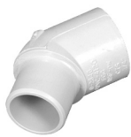
Parte No. CTS 2310 Codo 45° Espiga [Espiga x Cem]