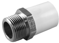
Parte No. CTS 2112 B Adaptador Macho con Inserto de Bronce (RM Bronce x Casquillo CTS)