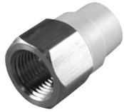
Parte No. CTS 2103 B Adaptador Hembra con Inserto de Bronce (RH Bronce x Casquillo CTS)

Nota: Un descuento diferente puede aplicarse a los artículos con inserto de bronce. Por favor póngase en contacto con la oficina de ventas.