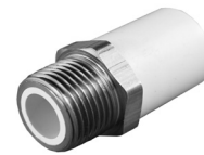
Parte No. CTS 2216 B Adaptador Macho con Inserto de Bronce (RM Bronce x Casquillo CTS)