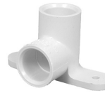
Parte No. CTS 2300 D Codo 90° Orejado [“Pipa” Todo en CPVC, Cem x Cem]