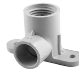
Parte No. CTS 2614 Codo 90° Orejado [“Pipa” Todo en CPVC, RH x Cem]