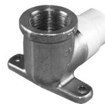
Parte No. CTS 2302 L Codo 90° Orejado con Inserto de Bronce Bajo en Plomo ("Pipa", Bronce RH x Casquillo CPVC)