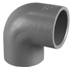
Parte No. PVC 8300 Codo de 90° (Cem x Cem)