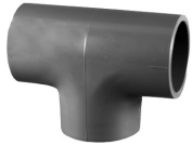
Parte No. PVC 8400 Tee (Cem x Cem x Cem)