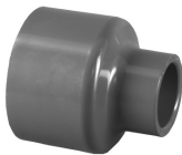
Parte No. PVC 8100 Cople Reducido (Cem x Cem)