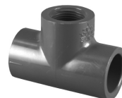
Parte No. PVC 8401 Tee (Cem x Cem x Rosca Hembra)