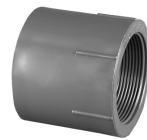
Parte No. PVC 8101 Adaptador Hembra (Cem x Rosca Hembra)