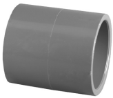
Parte No. PVC 8100 Cople (Cem x Cem)

§ La capacidad máxima de presión a 73°F (23°C) es de 150 PSI (10.54 Kg/cm²)