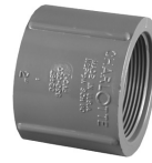
Parte No. PVC 8102 Cople Roscado (Rosca Hembra x Rosca Hembra)