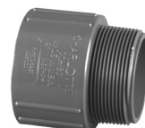
Parte No. PVC 8109 Adaptador Macho (Cem x Rosca Macho)