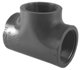
Parte No. PVC 8402 Tee Roscada (Rosca Hembra x Rosca Hembra x Rosca Hembra)