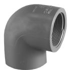
Parte No. PVC 8301 Codo de 90° (Cem x Rosca Hembra)