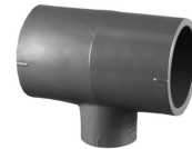
Parte No. PVC 8400 Tee Reducida (Cem x Cem x Cem)