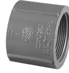
Parte No. PVC 8102 Cople Roscado (Rosca Hembra x Rosca Hembra)